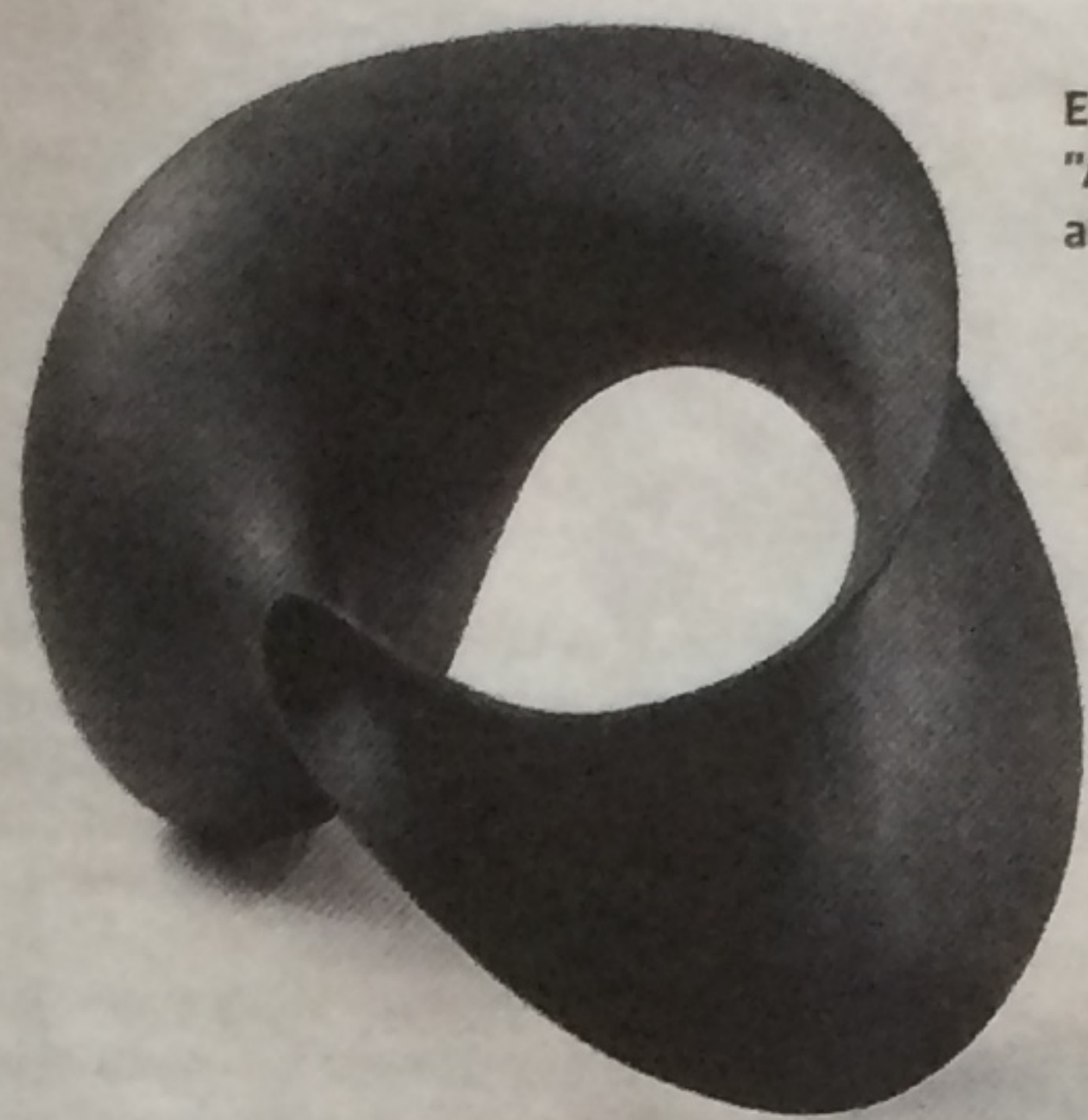
Eva Hilds "Around", aluminium.